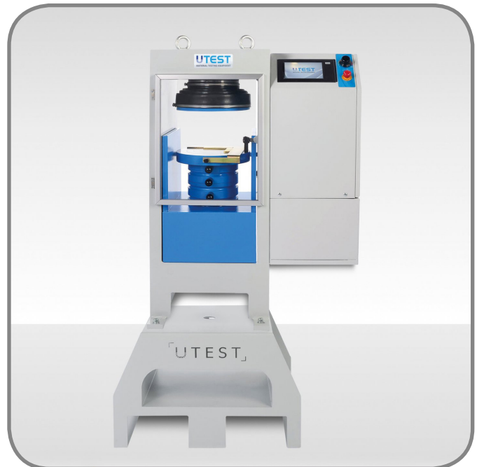
Presse de compression avec piédestal

Les machines de compression sont composées d'un bâti haute résistance, d'une centrale hydraulique et d'un boîtier de commande et d'acquisition U-Touch Pro.